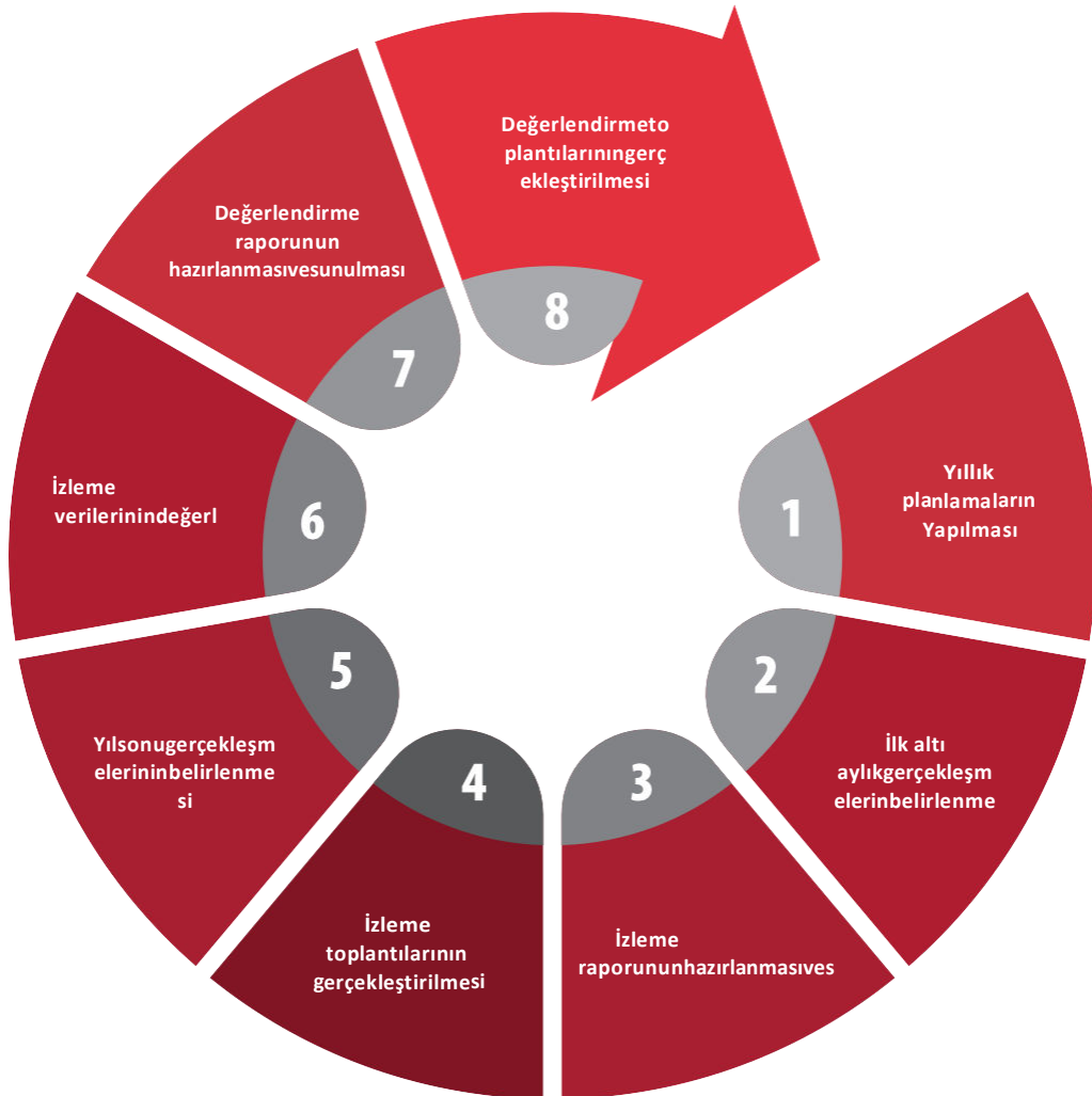
Şekil 6: İzleme ve Değerlendirme Süreci

Yılın tamamına ilişkin ikinci izleme kapsamında ise Müdürlüğümüz Stratejik Plan İzleme ve Değerlendirme Modülü vasıtasıyla, Strateji Geliştirme Şubesi tarafından harcama birimlerinden sorumlu oldukları performans göstergeleri ve stratejiler ile ilgili yıl sonu gerçekleşme durumlarına ait veriler toplanarak konsolide edilecektir.